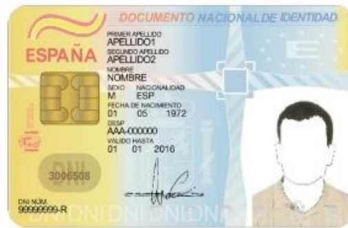
CARA DEL DNI